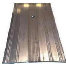
Les sols sont à la même hauteur

Couvrez les bords exposés ou les transitions vers d'autres surfaces de sol avec des finitions de plancher en aluminium disponibles localement, comme par exemple :