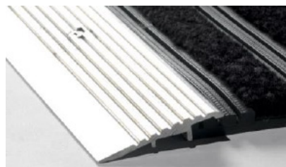
Pour les bords, utilisez de l'aluminium disponible localement

Couvrez et protégez le système de revêtement d'entrée jusqu'au nettoyage final avant l'ouverture.