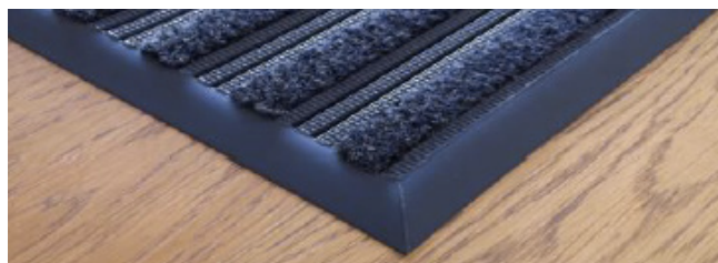
Pour les bords, utilisez une bordure en PVC